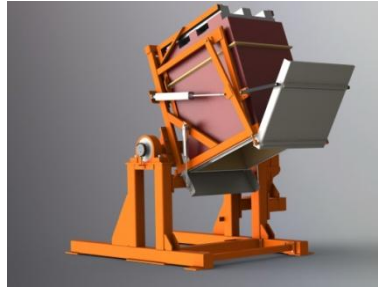
Gerendertes Projektbild Kippvorrichtung*

Das Dresdner Ingenieurbüro unterstützt als externer Dienstleister seine Kunden aus den verschiedensten Branchen der Region bei der Realisierung ihrer Projekte mit seinen Projekt-ingenieuren, Konstrukteuren oder Technischen Zeichnern.